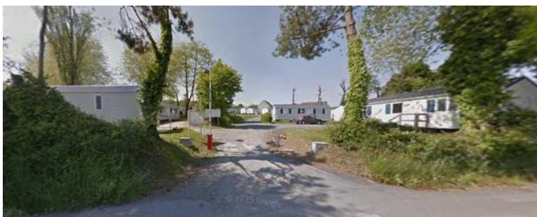
Entrée de la parcelle, depuis le parking du Haras, au sud.