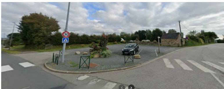
Entrée de la parcelle, avenue de la Côte des Isles.