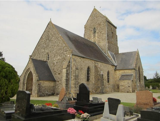
Eglise de Sainte-Colombe