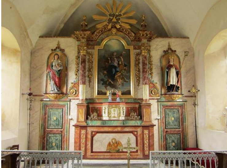
Maitre autel, Sainte Colombe