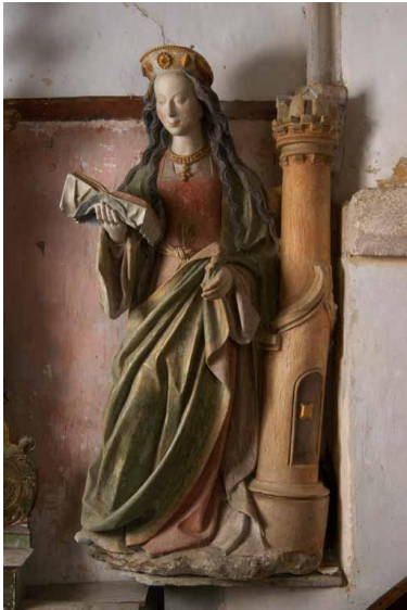
Statue de Sainte Barbe

de Gréville-Hague et de Chef-du-Pont lui sont consacrées.