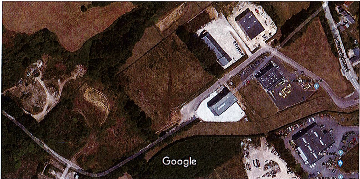
Images ©2020 CNES / Airbus, Maxar Technologies, Données cartographiques ©2020 20 m