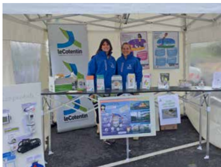
Les ambassadeurs du tri réalisent tout au long de l'année un travail de sensibilisation auprès des usagers

FACE À L'AUGMENTATION DES DÉCHETS MÉNAGERS , l'agglomération du Cotentin, aujourd'hui compétente en matière de gestion des déchets et d'environnement, s'implique dans le déploiement de nombreuses actions de sensibilisation au profit des habitants.