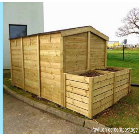
Pavillon de compostage

Véritables ambassadeurs au sein de leur famille, la sensibilisation des enfants aux gestes éco-citoyens est primordiale.