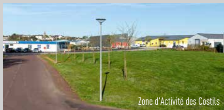
Zone d'Activité des Costils

La Communauté d'agglomération du Cotentin relance le projet d'extension de la Zone d'Activité des Costils (Les Pieux).