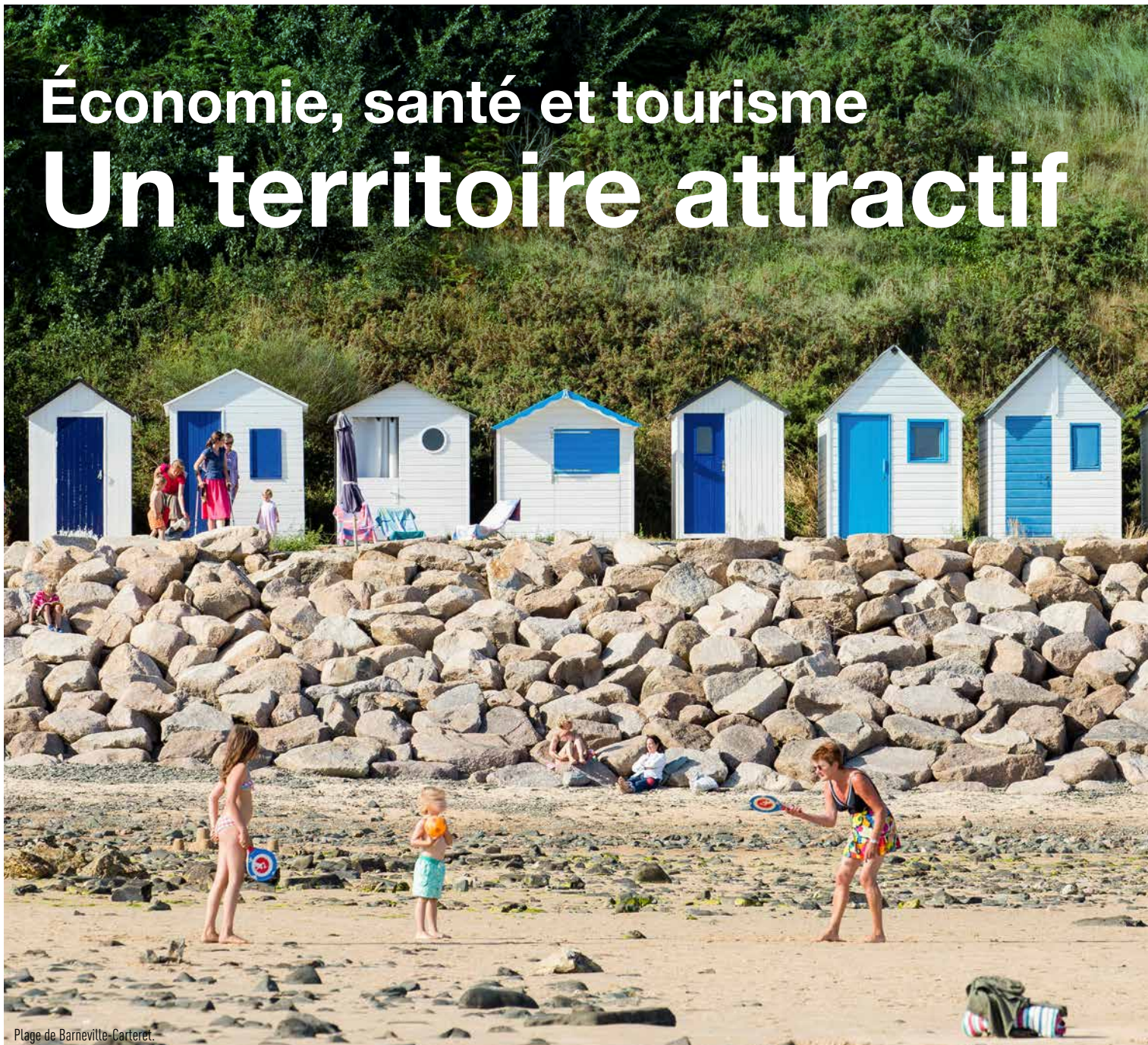
Plage de Barneville-Carteret.